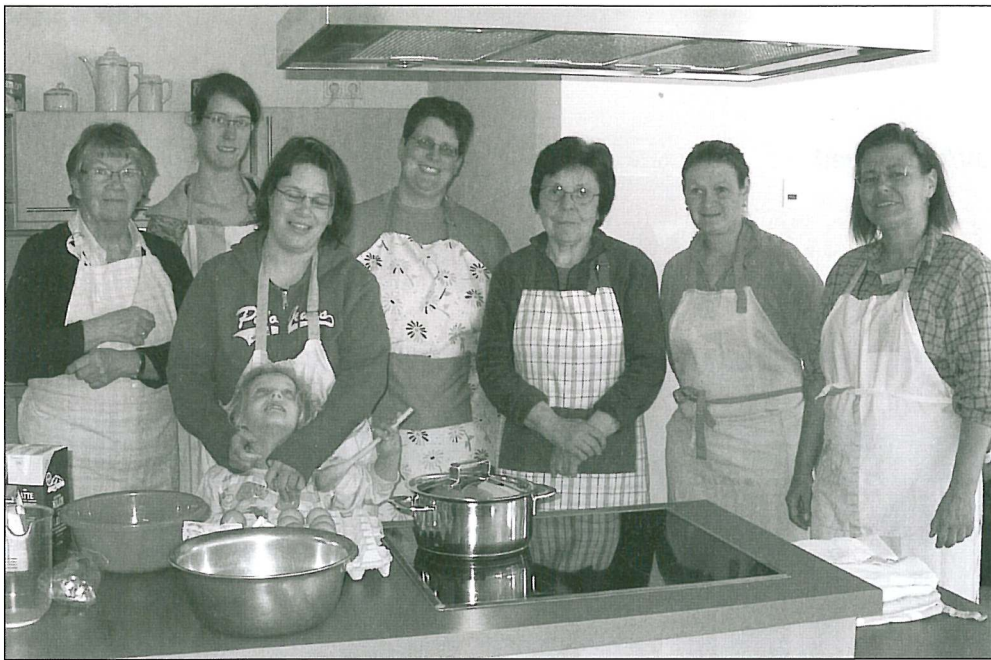
Das „Tischlein deck dich“ - Team des f.i.t.-Programms.